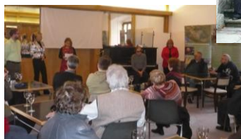
November 15-18./ XI. Civil Akadémia