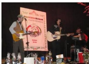
November 24./ A Magyar Kulturális Napok gálaestje