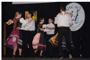
Október 24./ Táncház a Kincső néptáncscsoporttal