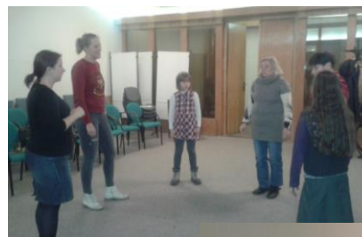
November 30. Gyerekfoglalkozás