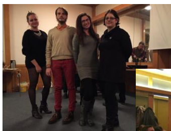
December 19./ CSMMSZ karácsonyváró