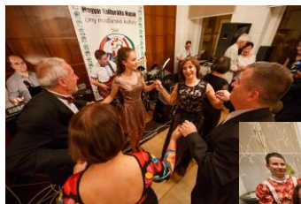
November 17./ A Magyar Kulturális Napok gálaestje