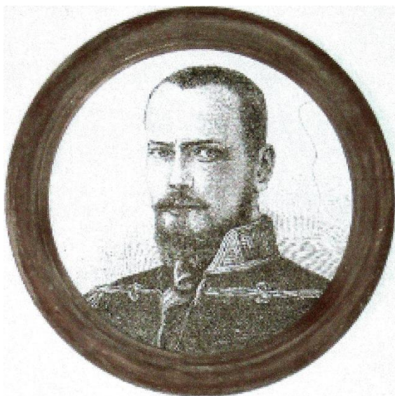
ARTUR GÖRGEY (1818-1916)

V TOMTO DOMĚ BYDLEL VÝZNAČNÝ VOJEVŮDCE MAĎARSKÉHO BOJE ZA SVOBODU V 1848-49. JAKO VÝZNAMNÝ CHEMIK PŮSOBIL V LETECH 1845-48 NA UNIVERZITĚ KARLOVĚ.