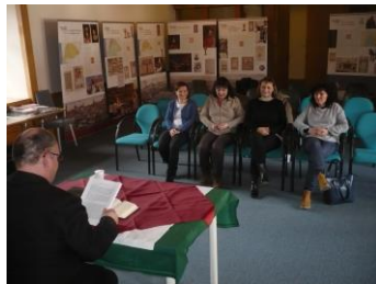
Február 24./ A magyar reformáció öt évszázada