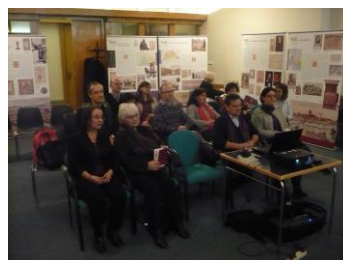
Március 2./ Évzáró taggyűlés